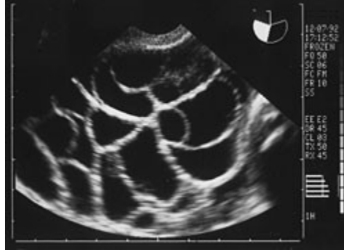
Aşırı uyarılmış yumurtalıklar

Polikistik overli hastalara yumurta gelişimini uyaran ilaçları kullanırken çok dikkatli olunmalı ve ilaç dozu çok iyi ayarlanmalıdır.İlaç dozu yetersiz olduğunda yumurta gelişimi olmadığı gibi uygunsuz dozda ilaç verildiğinde (bazen çok küçük dozda bile olabilir) yumurtalıkların aşırı uyarılması ve çok sayıda yumurta gelişimi olabilir.